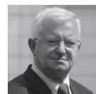
Dr. Rudolf Seiters (DRK Präsident)

WELCHES LEBEN RETTEN? STIFTUNG KNOCHENMARKSPENDE AKTION BAYERN Robert-Koch-Allee 7, 82131 Gauting Tel.: 089 / 89 32 96 28, Fax: 089 / 89 32 96 29 www.knochenmarkspende.de