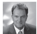
Gebhard Kaiser (Landrat des Landkreises Oberallgäu)